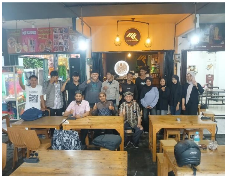
Gambar 9. Foto bersama narasumber.