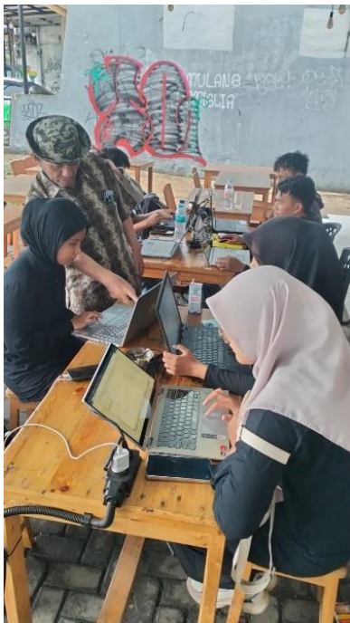
Gambar 2. Paparan materi pengenalan jurnal.

disampaikan, sebanyak 85% peserta sudah mengerti tentang jurnal, namun setelah materi disampaikan 100% peserta paham mengenai jurnal.