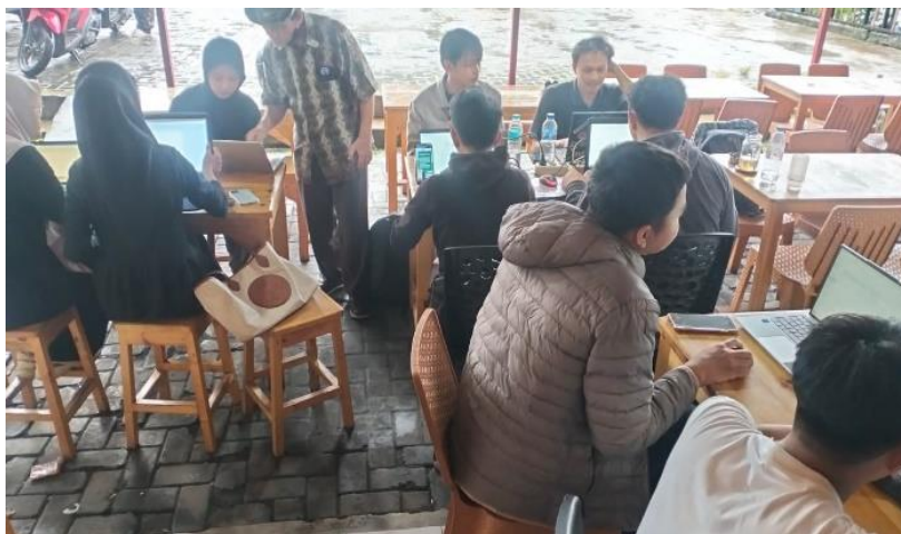
Gambar 6. Paparan materi publikasi jurnal.