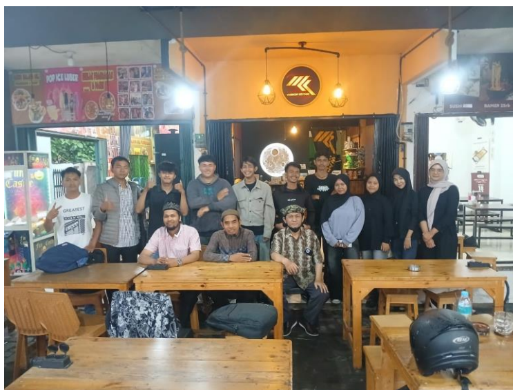
Gambar 7. Foto bersama narasumber.

Dari segi output , kegiatan ini tidak hanya menghasilkan draft artikel ilmiah dari masing-masing peserta, tetapi juga menumbuhkan minat terhadap dunia publikasi ilmiah. Dengan pembinaan lanjutan dan dukungan institusi, artikel-artikel tersebut berpotensi dipublikasikan secara resmi. Keterlibatan aktif peserta dan antusiasme yang tinggi juga menunjukkan bahwa kegiatan pelatihan ini berhasil menciptakan lingkungan belajar yang kolaboratif dan mendukung semangat akademik di kalangan mahasiswa dan mahasiswi.