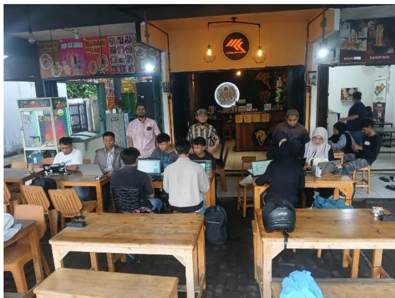
Gambar 4. Paparan materi penulisan naskah jurnal.