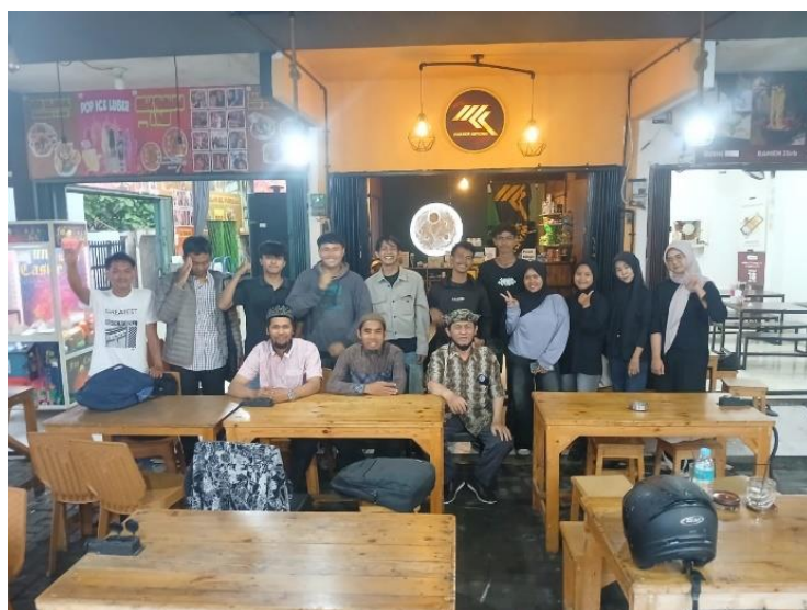
Gambar 8. Foto bersama narasumber.