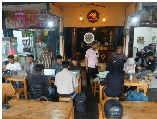
Gambar 3. Paparan materi simulasi penggunaan aplikasi mendeley.

Berdasarkan hasil pre test dan post test yang dilakukan dalam sesi simulasi penggunaan Aplikasi Mendeley, peserta pelatihan yang berjumlah 11 mahasiswa dan mahasiswi mayoritas belum mengetahui tentang Aplikasi Mendeley, di mana 95% belum mengerti menggunakan Aplikasi Mendeley. Hal itu terlihat saat dilakukannya praktik penggunaan Aplikasi Mendeley dalam mensitasi artikel yang dijadikan sebagai sumber penulisan dan untuk menjadi sumber referensi. Namun setelah diberikan pelatihan, peserta yang sudah mampu mengaplikasikan penggunaan software Mendeley ada sebanyak 90%.