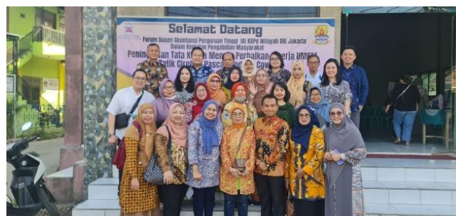
Gambar 2. Tim PkM

Berdasarkan saran dari Kepala Desa dan mempertimbangkan hasil survei awal tersebut, maka dilakukan penyuluhan kepada pelaku UMKM Batik Cirebon terkait hal-hal tersebut. Tim penyuluh terdiri dari 26 dosen dari 16 Perguruan Tinggi di wilayah DKI Jakarta. Berikut adalah foto tim Abdimas.