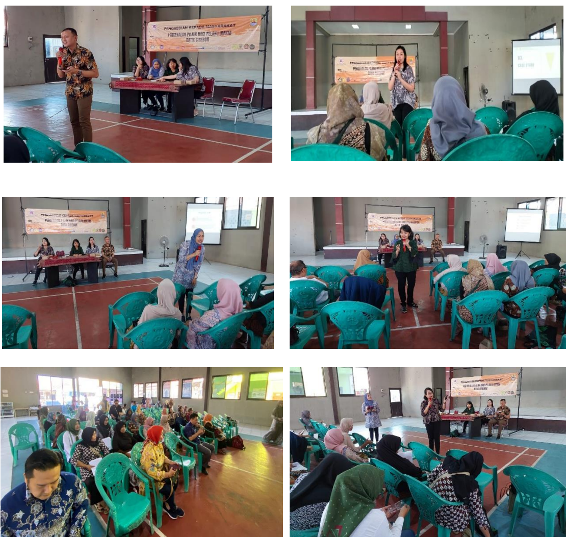
Gambar 3. Suasana PkM

Kegiatan PkM dibagi menjadi lima sesi/topik penyuluhan, yaitu: (1) edukasi perencanaan dan pencatatan kas, (2) edukasi pembukuan sederhana, (3) edukasi penentuan harga pokok produksi, (4) edukasi perpajakan, dan (5) edukasi pemasaran berbasis digital. Materi yang disampaikan tidak hanya berupa teori, tetapi juga studi kasus cara menghitung sehingga peserta dapat lebih memahami cara mencatat dan menghitung untuk usahanya sendiri.